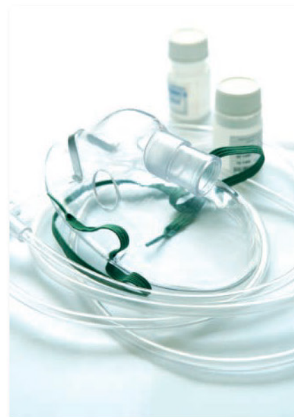
Adsale Exhibition Services Ltd. www.ChinaplasOnline.com

of medical device and consumables, as well as medical and pharmaceutical packaging companies to keep up with trends of medical plastics and their applications, the "3rd Medical Plastics Conference" will be held concurrently with CHINAPLAS. A myriad of edge-cutting and practical medical plastics products and solutions will be showcased in conference, guidebooks and as well as display cabinets in the high traffic Pearl Promenade.