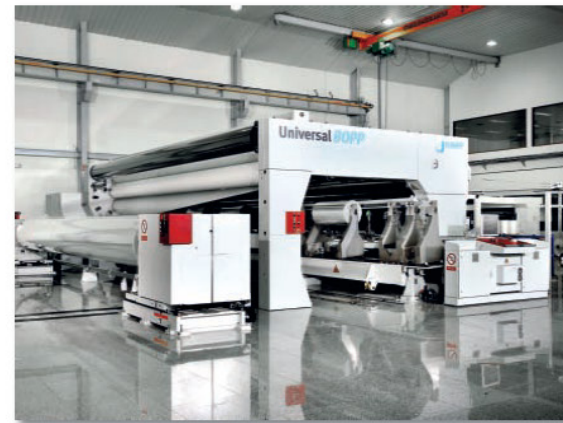
KAMPF Unislit II slitter for film producers and converters

BOPET line as well a new 8,7 m BOPP line for their plant in Indore, India. KAMPF already delivered one winder type Imperial, one primary slitters type Universal and two secondary slitters type Unislit II for the BOPET production.